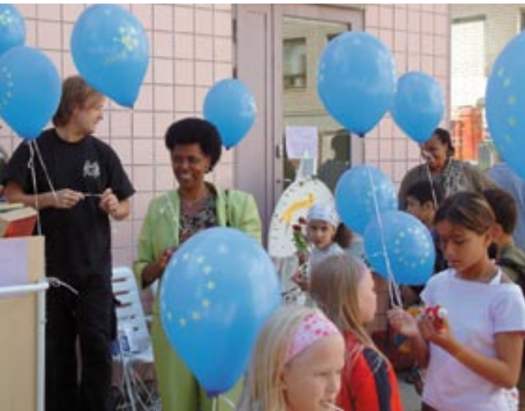
Γονείς και παιδιά στο νέο οικογενειακό κέντρο μεταναστών στην πόλη Vantaa, Φινλανδία

Το νέο ευρωπαϊκό δίκτυο Inforegio που αντικαθιστά το SFIT έχει στόχο να συγκεντρώσει φορείς επικοινωνίας από όλα τα επιχειρησιακά προγράμματα στο πλαίσιο του ΕΤΠΑ και του Ταμείου Συνοχής. Βασικοί στόχοι είναι η ανταλλαγή εμπειριών και ο προσδιορισμός τρόπων βελτίωσης της ποιότητας των δραστηριοτήτων επικοινωνίας και αύξησης της ευαισθητοποίησης σχετικά με τα οφέλη των κοινοτικών παρεμβάσεων στους δυνητικούς δικαιούχους και το ευρύ κοινό καθώς και η βελτίωση της ορατότητας των έργων που χρηματοδοτούνται από την ΕΕ. Οι προτεινόμενες προτεραιότητες για την περίοδο 2007–2013 είναι οι εξής: