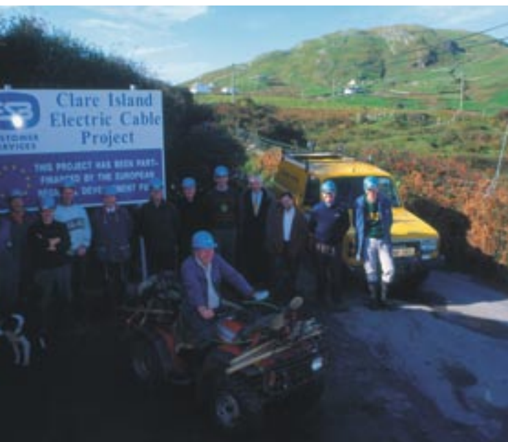
Ηλεκτροδότηση του Clare Island, Co. Mayo, Ιρλανδία

Ιστότοπος της οργάνωσης European Movement: http://www.europeanmovement.org/ .