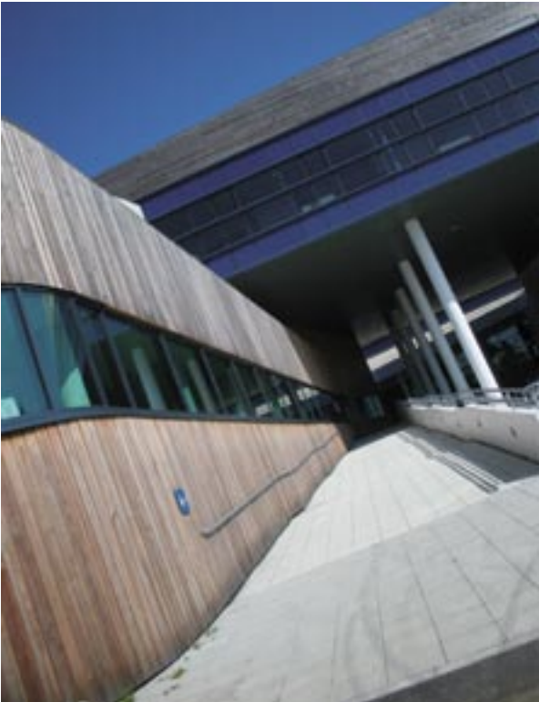
Η αρχιτεκτονική του Campus Hub στο Tremough συνδυάζει τον σύγχρονο χαρακτήρα με τα παραδοσιακά υλικά.

περιοχή. Στο πανεπιστήμιο, προσφέρουμε βοήθεια όλο το διάστημα που παραμένουν στη θέση αυτή».