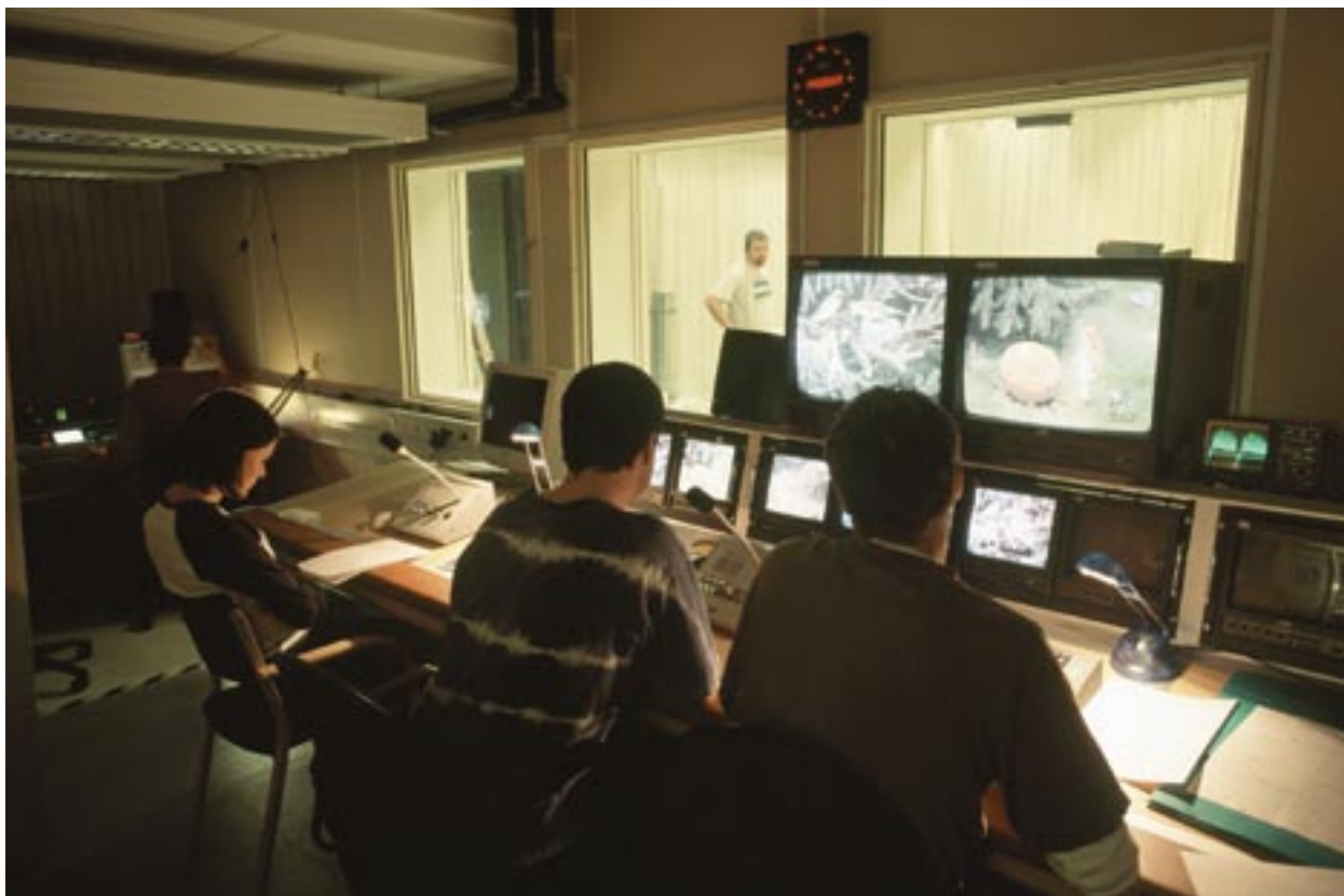
Εκπαίδευση στην ψηφιακή τεχνολογία: μαθήματα τηλεοπτικής παραγωγής στο Västernorrland, Σουηδία

σματικά, η Ευρωπαϊκή Επιτροπή σκοπεύει στη συμμετοχή όλων των μερών στην εφαρμογή των επιχειρησιακών προγραμμάτων, συμπεριλαμβανομένων των δικαιούχων.