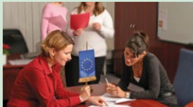
Η ομάδα επικοινωνίας της ΕΥΑ της Ουγγαρίας επί το έργον

Για περισσότερες πληροφορίες: szucs.judit@meh.hu ( www.nfh.hu )