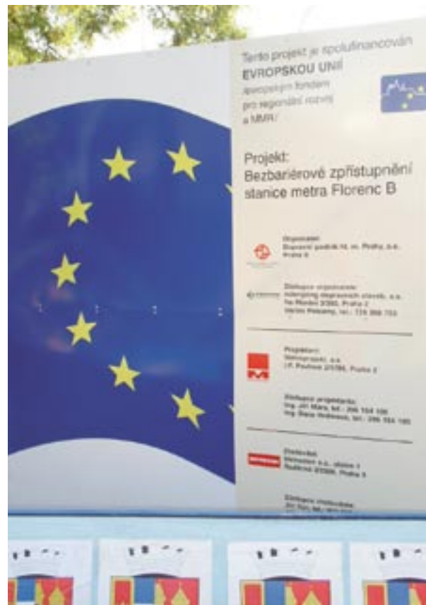
Πανακίδα για την κατασκευή ενός νέου σταθμού μετρό στην Πράγα, Τσεχική Δημοκρατία

Το συνέδριο με θέμα « Η ιστορία — Πολιτική συνοχής για την ανάπτυξη και την απασχόληση », που αφορά την πληροφόρηση και τη δημοσιότητα των διαρθρωτικών ταμείων, θα πραγματοποιηθεί στις Βρυξέλλες στις 26-27 Νοεμβρίου 2007 . Στόχος του είναι να προσελκύσει υπεύθυνους επικοινωνίας από όλα τα επιχειρησιακά προγράμματα. Αναμένονται περίπου 400-500 συμμετέχοντες. Η εκδήλωση θα λειτουργήσει ως ανοιχτή αγορά για την παρουσίαση διαφόρων επικοινωνιακών προσεγγίσεων και θα προσφέρει διάφορες ευκαιρίες δικτύωσης.