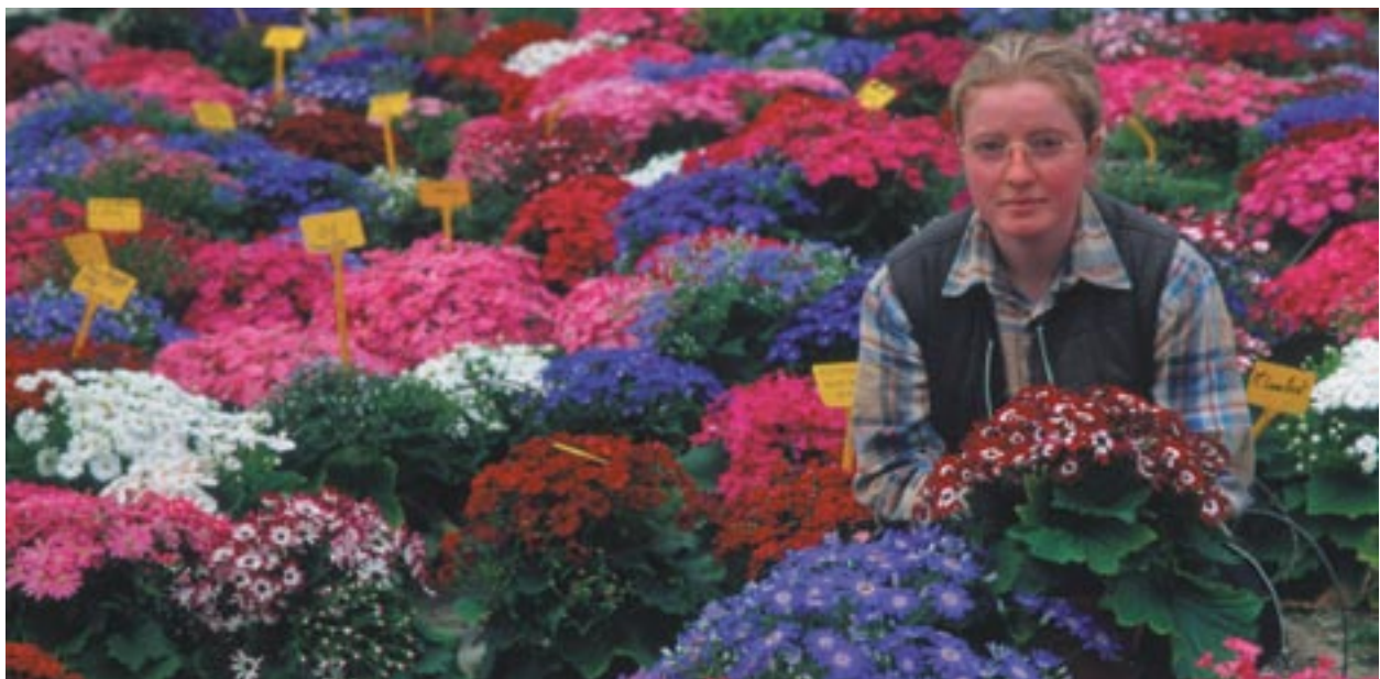
■ Ανθοκομική έρευνα και ανάπτυξη που συγχρηματοδοτείται από το ΕΤΠΑ στην πόλη Barfleur, Κάτω Νορμανδία, Γαλλία.

Ποιους θα ωφελήσουν τα κοινοτικά κονδύλια; Πώς ενημερώνεται το κοινό για τα έργα που χρηματοδοτούνται από τα διαρθρωτικά ταμεία; Ποια μέτρα πρότεινε η Επιτροπή για να διασφαλιστεί ότι λαμβάνεται υπόψη η γνώμη των ευρωπαίων πολιτών και ότι ενθαρρύνεται η συμμετοχή τους; Ποιος είναι ο ρόλος της Γενικής Διεύθυνσης Περιφερειακής Πολιτικής σε αυτή τη μακροχρόνια διαδικασία;