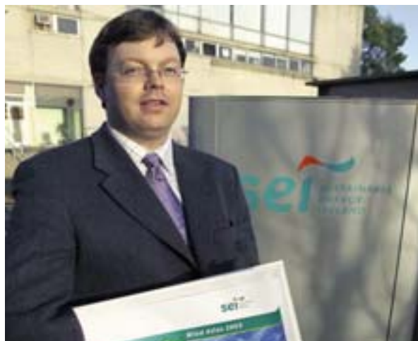
Η Ιρλανδία έχει δημοσιεύσει έναν «Εθνικό άτλαντα των ανέμων» για την ανάπτυξη της αιολικής ενέργειας.

Η ενεργειακή απόδοση ευνοεί την εγκατάσταση επιχειρήσεων και τη δημιουργία θέσεων απασχόλησης. Σύμφωνα με