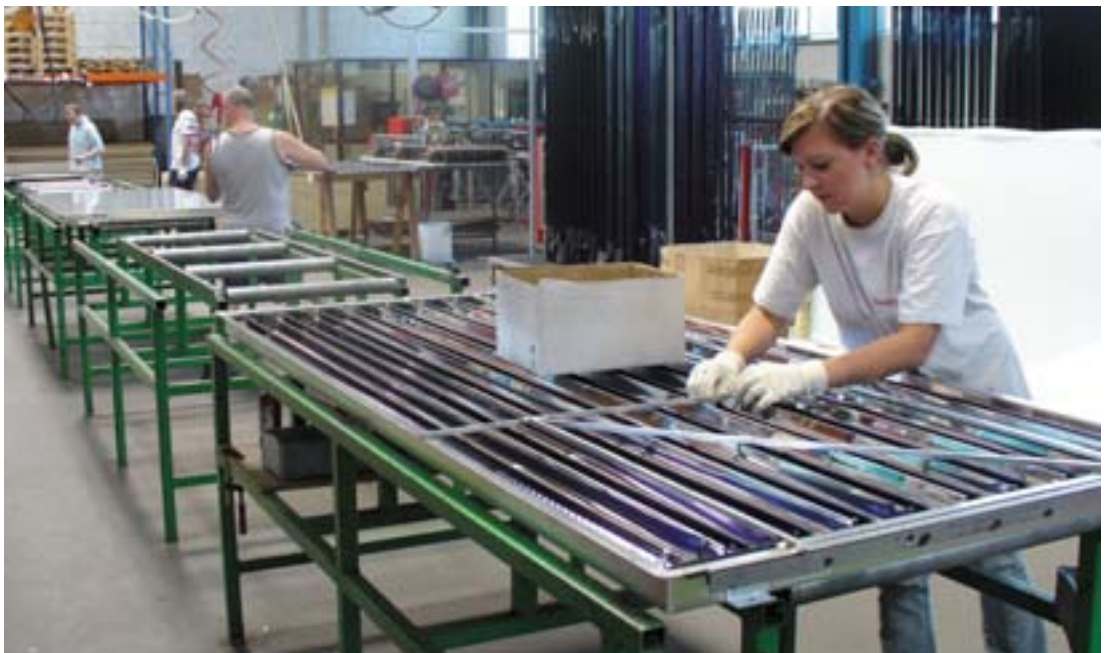
Παραγωγή ηλιακών συλλεκτών στο St-Ulrich

Από το 1991, η περιφέρεια της Άνω Αυστρίας εφαρμόζει μια συνεπή πολιτική στον τομέα της ενέργειας. Παρέχει κίνητρα για την ενεργειακή απόδοση, στηρίζει τις εναλλακτικές πηγές ενέργειας, πρότυπα σχέδια και υποδομές... Εκτός από τον τομέα των μεταφορών, το ένα τρίτο περίπου της ενέργειας που καταναλώνεται στο ομόσπονδο κράτος προέρχεται πλέον από ανανεώσιμες πηγές ενέργειας. Αυτό έχει θετικές επιπτώσεις στην περιφερειακή ανάπτυξη. Συναντήσεις και πρότυπα έργα.