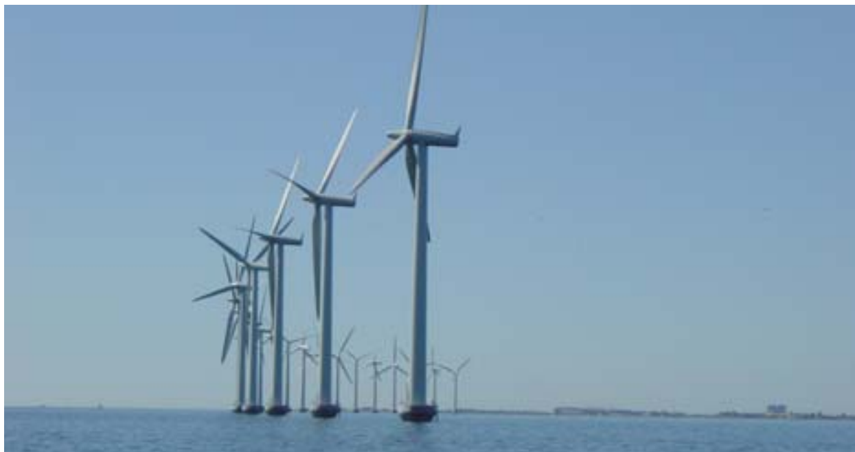
Αιολικό πάρκο στα ανοικτά των ακτών της Κοπεγχάγης (Δανία)