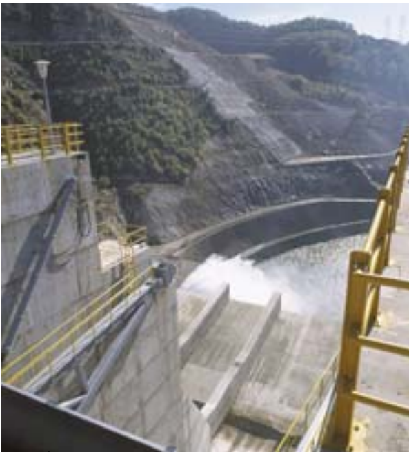
Υδροηλεκτρική ενέργεια χωρίς σύνορα: φράγμα στον ποταμό Νέστο μεταξύ Ελλάδας και Βουλγαρίας

Στον τομέα των κατασκευών και της κατοικίας, παράλληλα με το νομικό πλαίσιο, καθοριστική σημασία έχουν και οι αντιστοιχες στρατηγικές πληροφόρησης τόσο των χρηστών των κτιρίων όσο και πολλών φορέων που απαρτίζουν αυτόν τον κλάδο. Λόγω της γεωγραφικής εγγύτητας με τους πολίτες και τους οικονομικούς φορείς, οι περιφέρειες καλούνται να συμβάλουν στην κατασκευή ενεργειακά αποδοτικών, βιώσιμων και ευχάριστων κτιρίων.