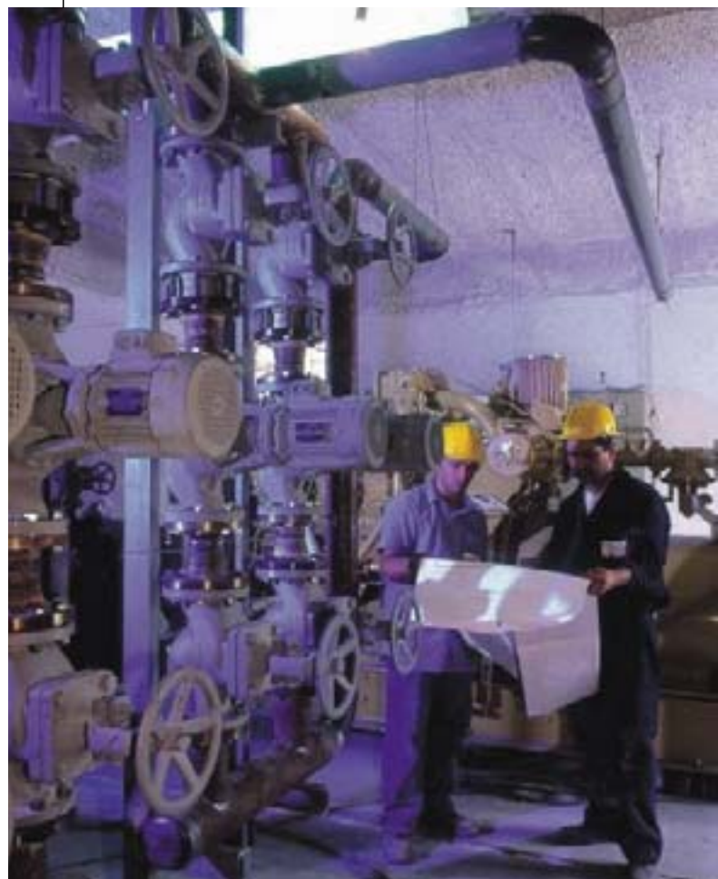
Παλέρμιο (Ιταλία): παραγωγή ηλεκτρικής ενέργειας από φυσικό αέριο

Η λεπτομερής περιγραφή των προγραμμάτων και στρατηγικών σχεδίων εξοικονόμησης ενέργειας είναι ασφαλώς απαραίτητη για να είναι σε θέση οι ειδικοί να λαμβάνουν τις αποφάσεις τους, αλλά δεν παρουσιάζει πραγματικό ενδιαφέρον για τους ιδιώτες. Αυτό που συμβάλλει κυρίως στη δημιουργία των απαραίτητων συνθηκών για να αλλάξουν