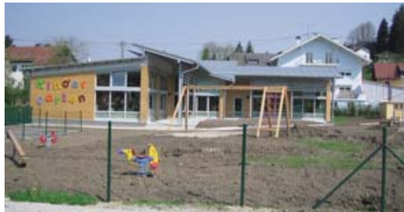
Βιοκλιματική, ο νέος βρεφονηπιακός σταθμός του Schneegattern καταναλώνει λιγότερη ενέργεια.

«Η ενέργεια είναι μαζί με τον πολιτισμό, τον κοινωνικό τομέα και τον τουρισμό μία από τις τέσσερις προτεραιότητες της κοινότητάς μας», τονίζει ο Erich Rippl, δήμαρχος του Lengau (4600 κάτοικοι). Από τις αρχές του 2005, το Schneegattern, ένα χωριό που ανήκει σ' αυτόν το δήμο, διαθέτει βρεφονηπιακό σταθμό τελευταίας τεχνολογίας σε όρους άνεσης για τα παιδιά, αλλά και όσον αφορά την αρχιτεκτονική και την ενέργεια: πρό-