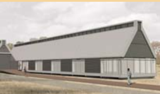
Το μελλοντικό κτίριο

Πληροφορίες: Samsø Danmarks Vedvarende Energi Ø (Denmark's Renewable Energy Island), www.veo.dk