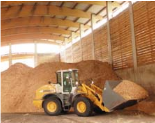
Αποθήκη πριονιδιού θέρμανσης

νάλωσης ενέργειας και η κλιματική αλλαγή, να λαμβάνονται σε ευρωπαϊκό επίπεδο (?). Προσφέρονται σημαντικές οικονομικές και οικολογικές ευκαιρίες, ιδίως στα νέα κράτη μέλη, όπου το δυναμικό ενεργειακής απόδοσης και ανανε-