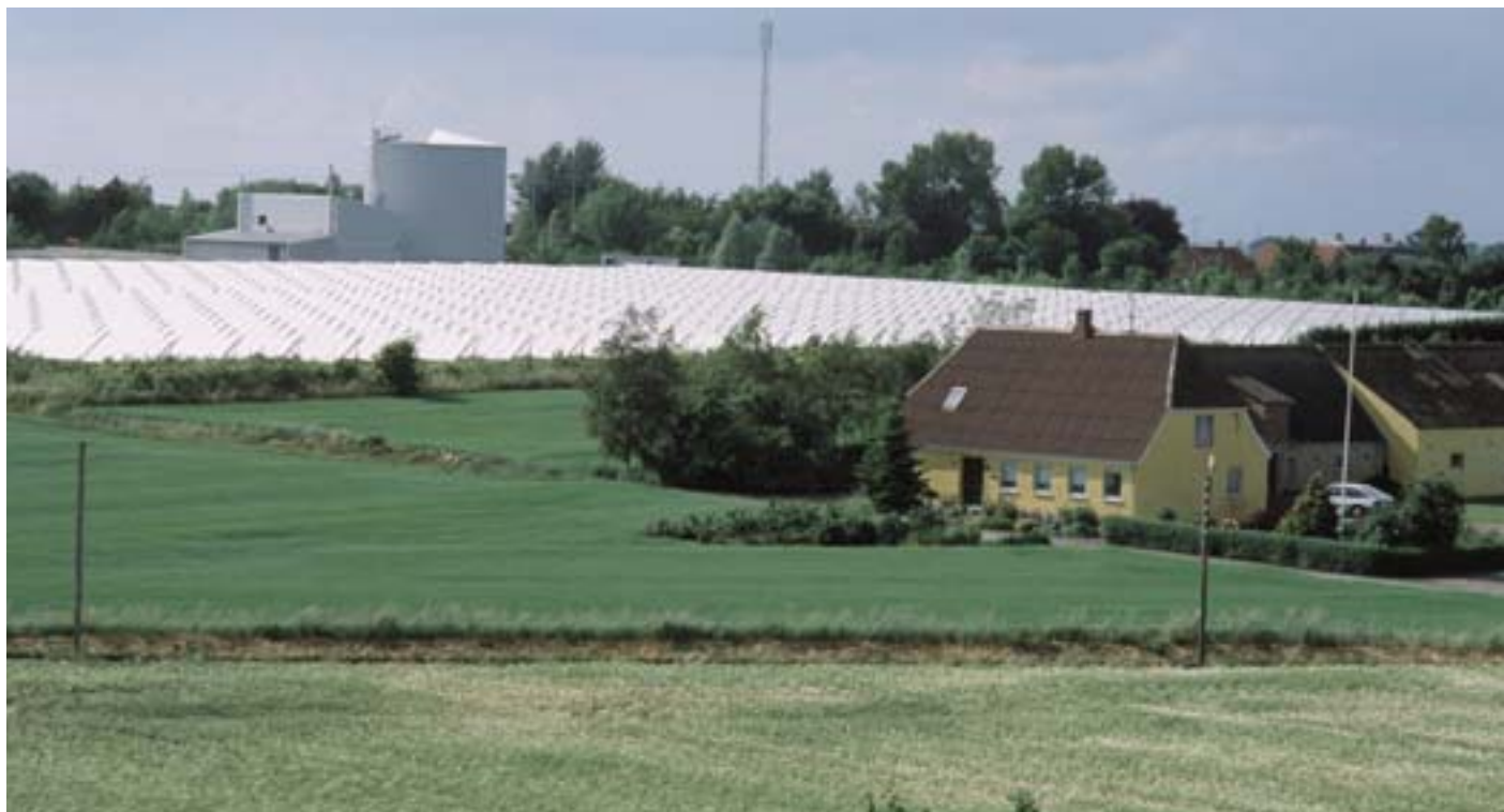
«Ηλιακό πάρκο» στο Μάρσταλ (Δανία)

Οι περιφέρειες, που βρίσκονται δίπλα στους φορείς υλοποίησης σχεδίων, έχουν να διαδραματίσουν σημαντικό ρόλο στην επίτευξη των στόχων της ασφάλειας εφοδιασμού, της ανταγωνιστικότητας και της βιωσιμότητας, προωθώντας στο πεδίο δράσης την ενεργειακή απόδοση, τις ανανεώσιμες μορφές ενέργειας και τις καινοτόμες τεχνολογίες. Αυτό θα έχει θετικές επιπτώσεις για την οικονομία και την τοπική απασχόληση.