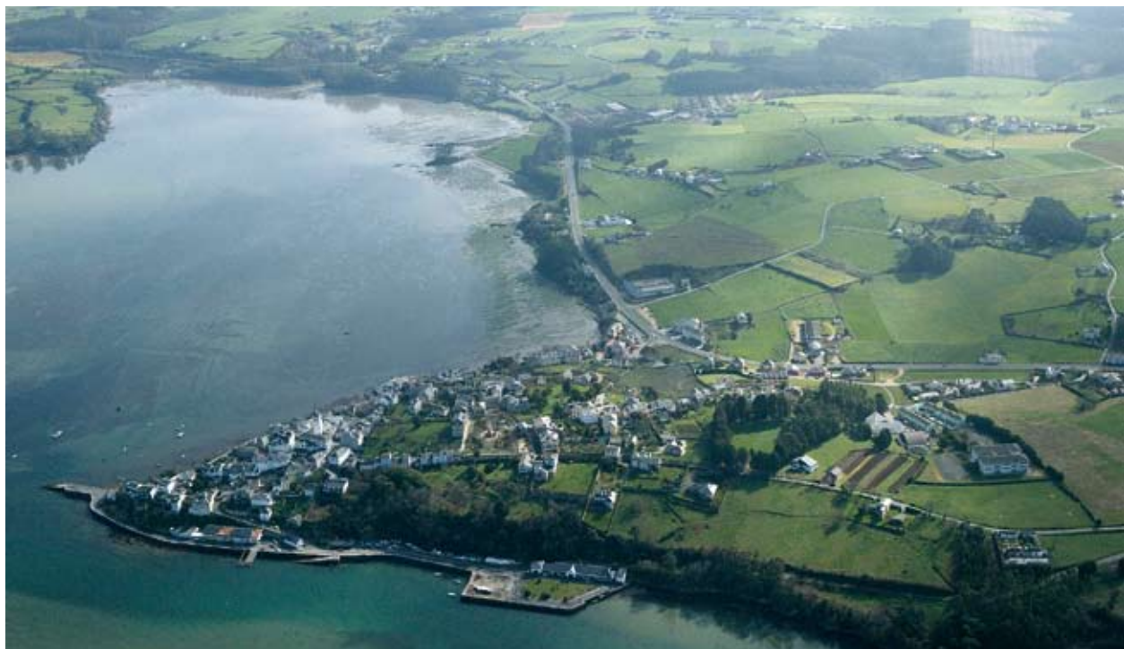
Το Castropol, στο δυτικό άκρο της περιφέρειας Αστούριας

Αντιμέτωπη με την αναδιάρθρωση μειζόνων κλάδων της οικονομίας της – γεωργία, αλιεία, σιδηροοδία – η περιφέρεια Αστούριας επιδιώκει την αξιοποίηση των πλεονεκτημάτων των ακτών της (φυσικών, πολιτιστικών και ανθρωπίνων) προκειμένου να διασφαλίσει την (εκ νέου) ανάπτυξή της. Αυτό αποτελεί και την ουσία της περιφερειακής θαλάσσιας πολιτικής.