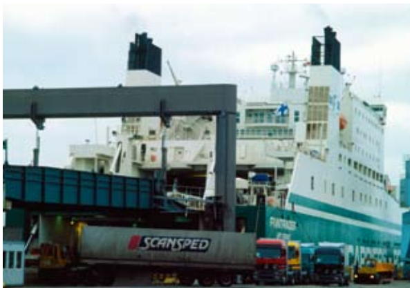
Φερμπότ στο λιμάνι του Κιέλου (Γερμανία)

Επίσης, μέσω της πρωτοβουλίας EUROPE INNOVA (2) , η Ευρωπαϊκή Επιτροπή έθεσε σε εφαρμογή ένα σχέδιο χαρτογράφησης των ευρωπαϊκών συνεργατικών σχηματισμών. Ο στόχος της πρωτοβουλίας είναι έως το τέλος του 2007 να έχει ολοκληρωθεί