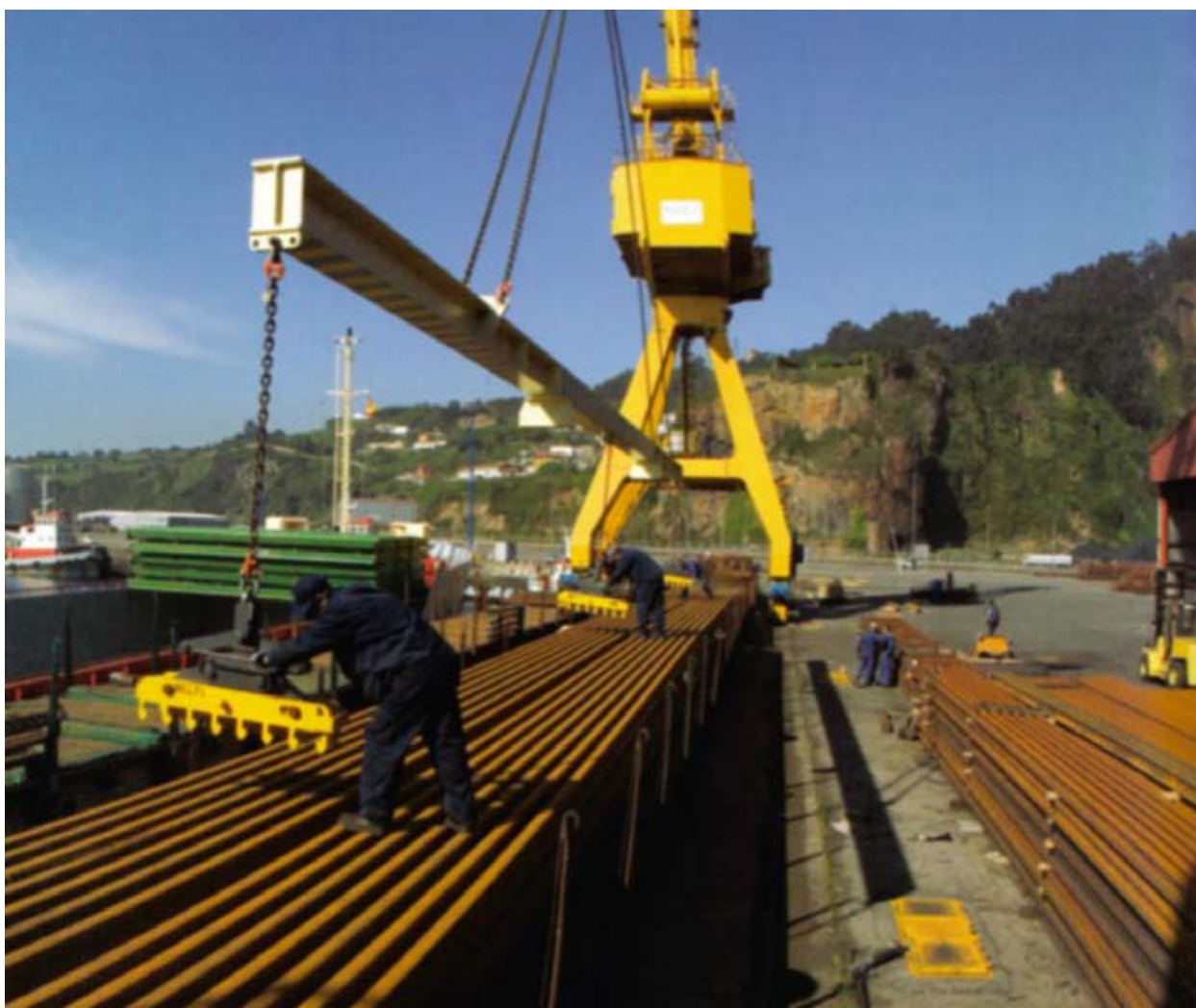
Ο τερματικός σταθμός προϊόντων σιδηρουργίας στο λιμάνι της Γιζόν

Το λιμάνι της Γιζόν, όπου διακινούνται 20 εκατομμύρια τόνοι εμπορευμάτων το χρόνο, είναι προφανώς μείζων μοχλός ανάπτυξης για την περιφέρεια. Από το 2004 βρίσκονται σε εξέλιξη τα έργα επέκτασής του, με μεγάλη χρηματοδότηση από την Ευρωπαϊκή Ένωση: 563 900 000 ευρώ, κατά το ήμισυ σχεδόν από το Ταμείο Συνοχής και 250 000 000 υπό τη μορφή δανείου από την Ευρωπαϊκή Τράπεζα Επενδύσεων (ΕΤΕπ). Η επέκταση αυτή θα αυξήσει τη δυναμικότητα επεξεργασίας και αποθήκευσης φορτίων θαλάσσιας μεταφοράς που διαμετακομίζονται μέσω του πρώτου λιμανιού της Αστούριας. Πρέπει κυρίως