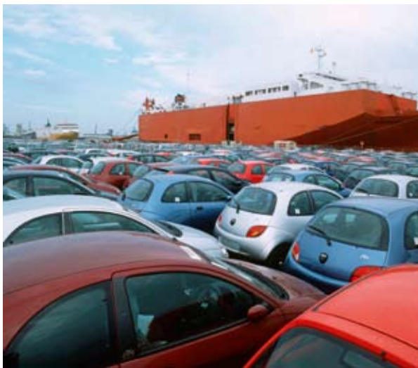
Τερματικός σταθμός αυτοκινήτων στο λιμάνι της Βαλένθια (Ισπανία)

Τέλος, οι συνεργατικοί σχηματισμοί μπορούν να υπολογίζονται σε σημαντική στήριξη από την ευρωπαϊκή πολιτική συνοχής. Πράγματι, μεταξύ των επενδύσεων που θα πραγματοποιηθούν