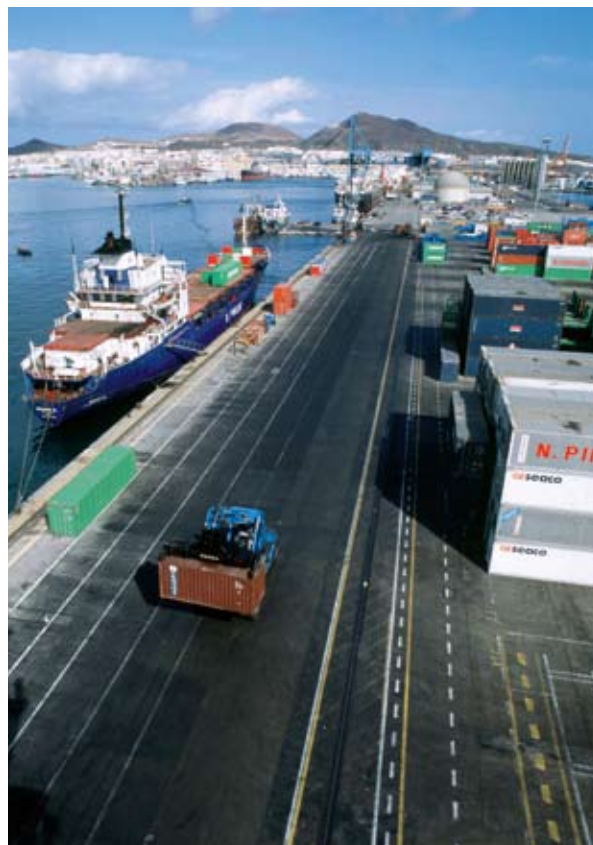
Ανάπτυξη του λιμανιού διακίνησης εμπορευματοκιβωτίων στη Las Palmas (Κανάριοι Νήσοι, Ισπανία)

Από το 2005, η Ευρωπαϊκή Ένωση επιδιώκει την εδραίωση μιας ολοκληρωμένης θαλάσσιας πολιτικής. Αυτό το ανανεωμένο ενδιαφέρον για τις θαλάσσιες δραστηριότητες ανέδειξε την οικονομική τους σημασία αλλά και την αλληλεξάρτησή τους. επανέφερε επίσης στο προσκήνιο τη συμβολή αυτών των κλάδων στην ευρωπαϊκή μεγέθυνση και τις ανάγκες τους από την άποψη της καινοτομίας. Για όλους αυτούς τους λόγους, η Ένωση θα εξακολουθήσει να υποστηρίζει την ανάπτυξη των καινοτόμων συνεργατικών σχηματισμών του θαλάσσιου τομέα, κυρίως μέσω των πολιτικών της για την έρευνα και τη συνοχή και των δράσεων της υπέρ των επιχειρήσεων και του θαλάσσιου τομέα εν γένει. Οι συνεργατικοί σχηματισμοί μπορούν να αποτελέσουν καίριο εργαλείο μιας φιλόδοξης θαλάσσιας πολιτικής, επιτρέποντας την επίτευξη απτών αποτελεσμάτων στον τομέα της τεχνολογικής καινοτομίας και την οικονομική ανάπτυξη των περιοχών.