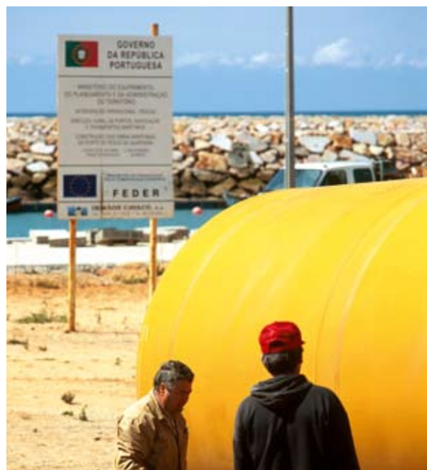
Εκσυγχρονισμός του λιμανιού της Quarteira (Πορτογαλία)

Θα μπορούσε φυσικά να υποστηριχθεί ότι η πλειονότητα των προτεινόμενων μέτρων θα υιοθετούνταν ούτως ή άλλως από τις αρμόδιες υπηρεσίες της Επιτροπής. Ωστόσο, η επιτυχία της ολοκληρωμένης θαλάσσιας πολιτικής της ΕΕ θα εξαρτηθεί από τον σωστό συντονισμό αυτών των μέτρων προκειμένου να εξυπηρετηθεί ο συνολικός σκοπός της ορθολογικής ανάπτυξης. Αυτή η επιδίωξη εκφράστηκε στη διαδικασία διαβούλευσης της Πράσινης Βίβλου και αυτός είναι εξάλλου ο λόγος που ο τομέας ναυτιλιακών υποθέσεων της Γενικής Διεύθυνσης Αλιείας αναμένεται κανονικά να παγιώσει το ρόλο του στο εγγύς μέλλον, παράλληλα με την περαιτέρω ενίσχυση των εξουσιών του.