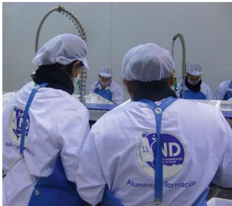
Εκπαίδευση νεοπροσληφθέντων στο Cudillero

Η κοινότητα του Cudillero αποτελεί ένα πολύ καλό παράδειγμα: εδώ, στο πλαίσιο του τεχνολογικού σχεδίου «C@R» (Collaboration@Rural: μια συνεργατική πλατφόρμα για την εργασία και τη διαβίωση στην ύπαιθρο) που χρηματοδοτείται από το 6ο πρόγραμμα-πλαίσιο έρευνας και ανάπτυξης (ΠΠΕ&Α), η ένωση αλιέων Virgen del Carmen δοκιμάζει ένα μηχανισμό πλήρους ιχνηλασιμότητας μέσω GPS. «Πρόκειται για ιχνηλασιμότητα από το αγκίστρι ως το πιρούνι», δηλώνει με ενθουσιασμό ο Enrique Plaza, της Γενικής Διεύθυνσης Αλιείας της κυβέρνησης της Αστούριας. «Η ιχνηλασιμότητα είναι πλήρης και ακαριαία: οι αλιείς φθάνουν στο αλιευτικό πεδίο· καθώς ανεβάζουν τα αλιεύματα στο σκάφος, τα καταγράφουν και αποστέλλουν τα δεδομένα στο λιμάνι του Cudillero μέσω WiFi ή