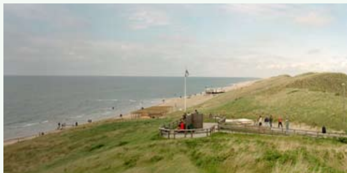
Οι θίνες παρέχουν ταυτόχρονα προστασία και πανοραμική θέα