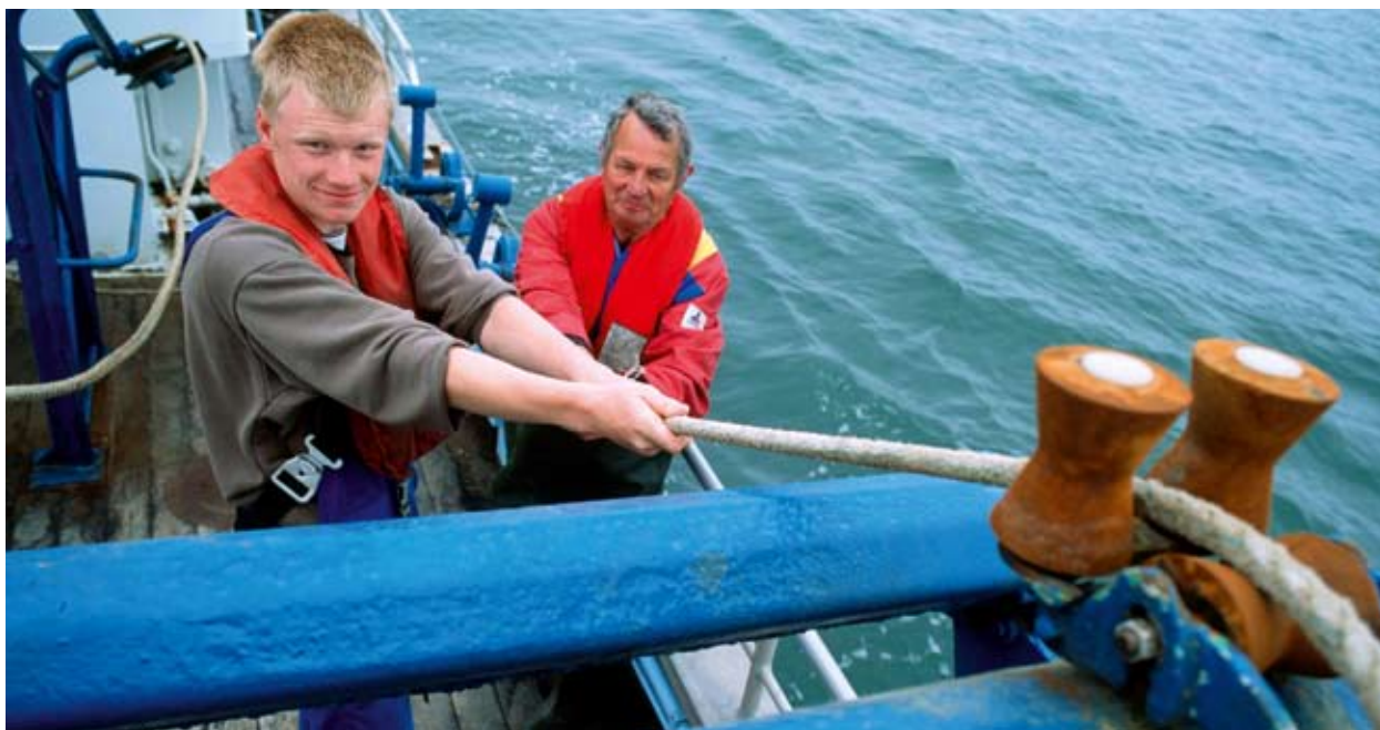
Ψάρεμα στα ανοιχτά του Thyborøn (Δανία).

Παρουσιάζοντας στις 10 Οκτωβρίου 2007 τη Γαλάζια Βίβλο της για μια ολοκληρωμένη θαλάσσια πολιτική για την Ευρωπαϊκή Ένωση («Ένας ωκεανός ευκαιριών») και το σχέδιο δράσης που περιέχει, η Επιτροπή ανταποκρίθηκε σε μια από καιρό υφιστάμενη ανάγκη που κατέστη πρόσφατα επιτακτική: την ανάγκη συντονισμού των δημόσιων πολιτικών που άπτονται του ευρωπαϊκού θαλάσσιου και παράκτιου χώρου.