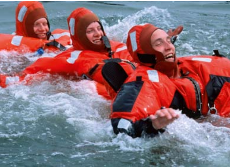
Κατάρτιση σε θέματα θαλάσσιας ασφάλειας

ναυτιλιακές υποθέσεις. Η Γαλάζια Βίβλος είναι ένα «πακέτο» που περιλαμβάνει δύο ανακοινώσεις της Επιτροπής, αμφότερες πολιτικού χαρακτήρα, και δύο έγγραφα εργασίας – ένα σχέδιο δράσης και μία μελέτη επιπτώσεων – που εκπονήθηκαν υπό το συντονισμό της ειδικής υπηρεσίας για τη θαλάσσια πολιτική στο πλαίσιο μιας εντατικής διυπηρεσιακής συνεργασίας. η συνεργασία αυτή υποστηρίχθηκε σε υψηλό επίπεδο από τους ίδιους τους επιτρόπους οι οποίοι συνέστησαν μια ομάδα επαφής για το σκοπό αυτό.