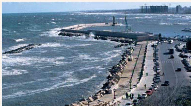
Το λιμάνι του Μπάρι (Ιταλία)

Χαιρετίζουν τα θετικά σημεία της «Γαλάζιας Βίβλου για μια ολοκληρωμένη θαλάσσια πολιτική για την Ευρωπαϊκή Ένωση»: τη δημιουργία και την καθιέρωση συναφών προς τη θάλασσα συνεργατικών σχηματισμών («maritime clusters»), τη δρομολόγηση πιλοτικών σχεδίων για το μετριασμό των επιπτώσεων της κλιματικής αλλαγής, καθώς επίσης την ευρωπαϊκή στρατηγική για τη θάλασσα έρευνα την οποία θα παρουσιάσει η Επιτροπή το 2008.