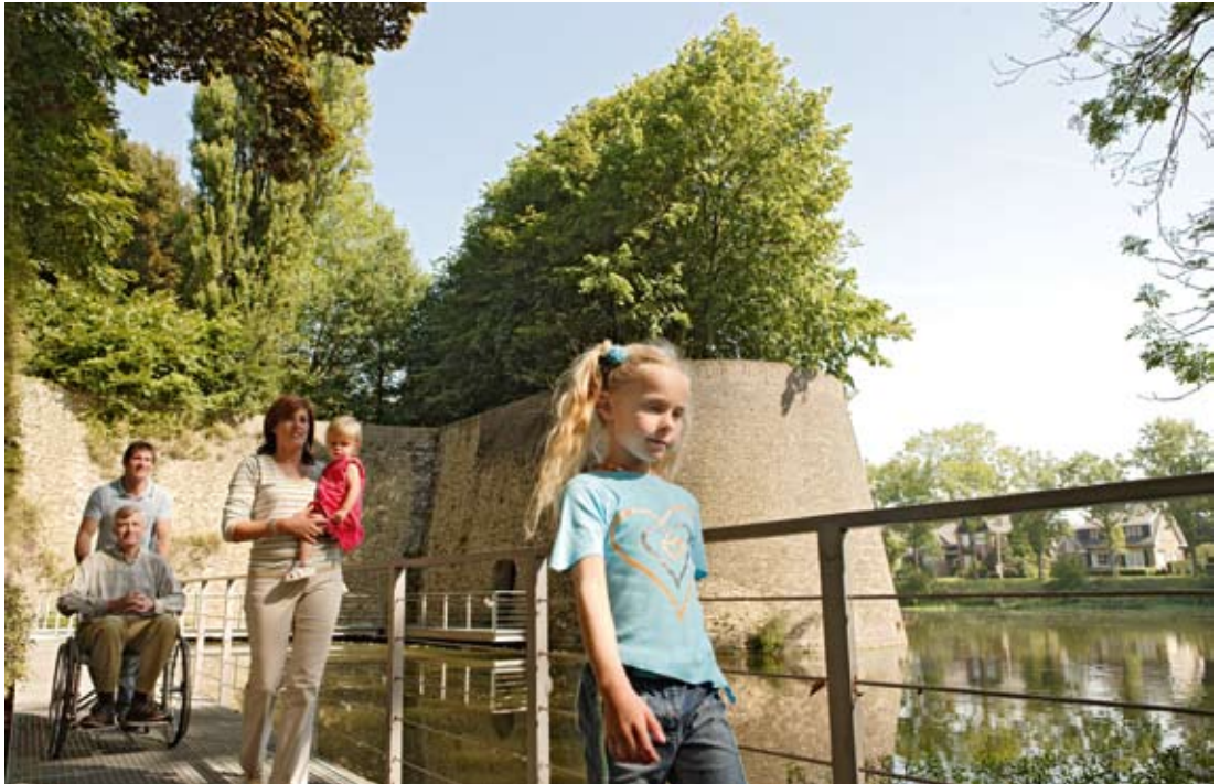
Ένας πολιτισμικός τουρισμός ανοιχτός σε όλους είναι προτεραιότητα για το «Δίκτυο Οχρωμένων Πόλεων».

Εκατοντάδες εταιρικές σχέσεις στους τομείς της υγείας, του πολιτισμού, της τεχνολογίας, του περιβάλλοντος, της συμμετοχής του πολίτη στα κοινά κ.ά. Από το PACTE έως το INTERREG IV, η γαλλοβελγική διασυνοριακή συνεργασία αποδεικνύεται εξαιρετικά επιτυχή.