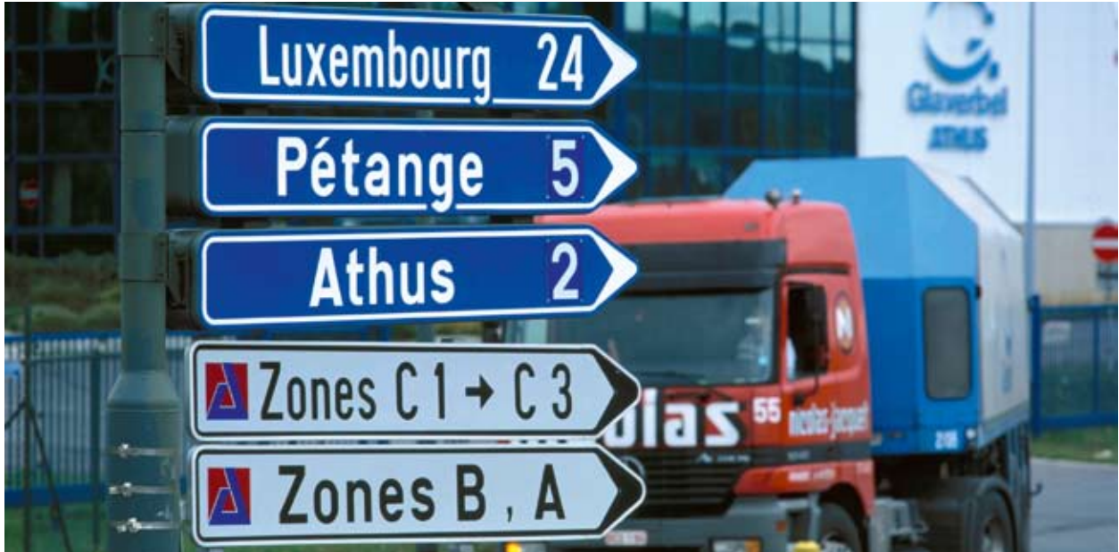
Πολυσύχναστη διαδρομή για τα φορτηγά που διασχίζουν τα σύνορα Βελγίου, Γαλλίας και Λουξεμβούργου.

Πηγαίνοντας με το αυτοκίνητο από τις Βρυξέλλες στο Λουξεμβούργο και από εκεί στο Στρασβούργο, έχει κανείς την εντύπωση ότι η ΕΕ δεν έχει πια εσωτερικά σύνορα. Όμως, ακόμη και εδώ, στην καρδιά της Ευρώπης, ο ρόλος του INTERREG παραμένει ζωτικής σημασίας για την εξάλειψη της επιρροής των συνόρων και τη διασφάλιση της σωστής λειτουργίας της εσωτερικής αγοράς.