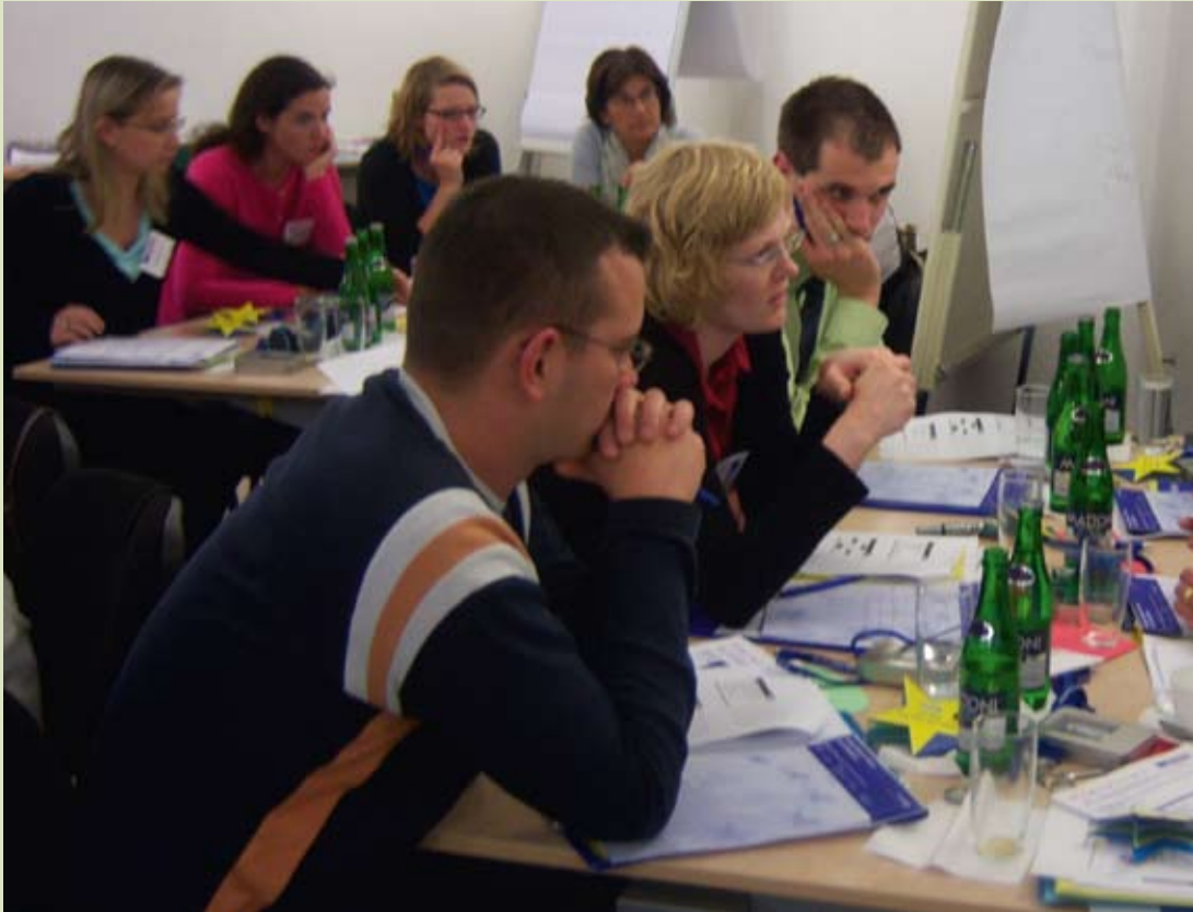
Ομαδική συζήτηση σε σεμινάριο INTERACT.