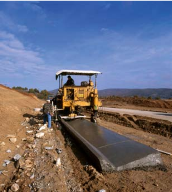
Κατασκευή νέας οδικής αρτηρίας μεταξύ Ελλάδας και Βουλγαρίας.

του ορίου χιονοκάλυψης). Η διαπεριφερειακή συνιστώσα (σκέλος Γ) συνενώνει και τα 27 κράτη μέλη της ΕΕ συν τη Νορβηγία και την Ελβετία. Αν εμείς οι Ευρωπαίοι θέλουμε πράγματι να διδαχθούμε ο ένας από τον άλλο και να πάψουμε να εφευρίσκουμε τον τροχό ξανά και ξανά, τότε το σκέλος Γ έχει πολλά να μας προσφέρει.