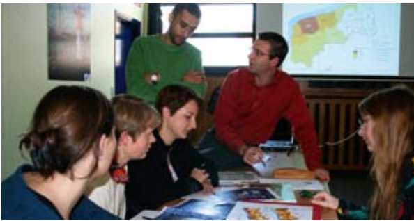
Έργο «GoGIS»: δημιουργία ενός διασυνοριακού Συστήματος Γεωγραφικών Πληροφοριών.

Οι ευκαιρίες για νέα έργα πολλαπλασιάζονται με το INTERREG IV – τα δύο μουσεία είναι έτοιμα να συνεργαστούν με νέους και αρκετά σημαντικούς εταίρους: διασυνδέονται με το Λούβρο, το οποίο θα έχει παράρτημα στη Lens από το 2008, και με το μουσείο Dr. Guislain της Γάνδης που ειδικεύεται στην art brut. Άλλες ιδέες υπό συζήτηση είναι το έργο «Navettes de l'Art» (γραμμή λεωφορείων μεταξύ των πόλεων Γάνδη, Λίλλη, Hornu, Lens κλπ.) και το έργο «Musées jardins» (καλοκαιρινές δραστηριότητες που απευθύνονται σε οικογένειες), η συγκέντρωση εγγράφων από τις συλλογές των τεσσάρων μουσείων και ακόμη μια έκθεση στο κτίριο ενός πρώην τελωνείου.