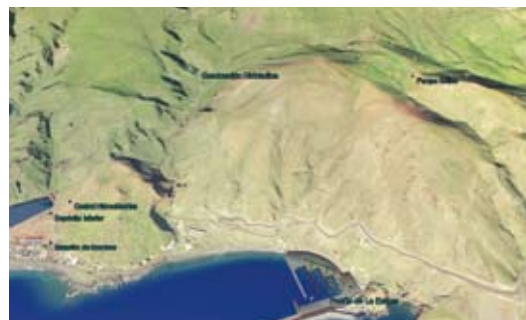
Μια άποψη του συστήματος.

Για περισσότερες πληροφορίες: itc@itccanarias.org