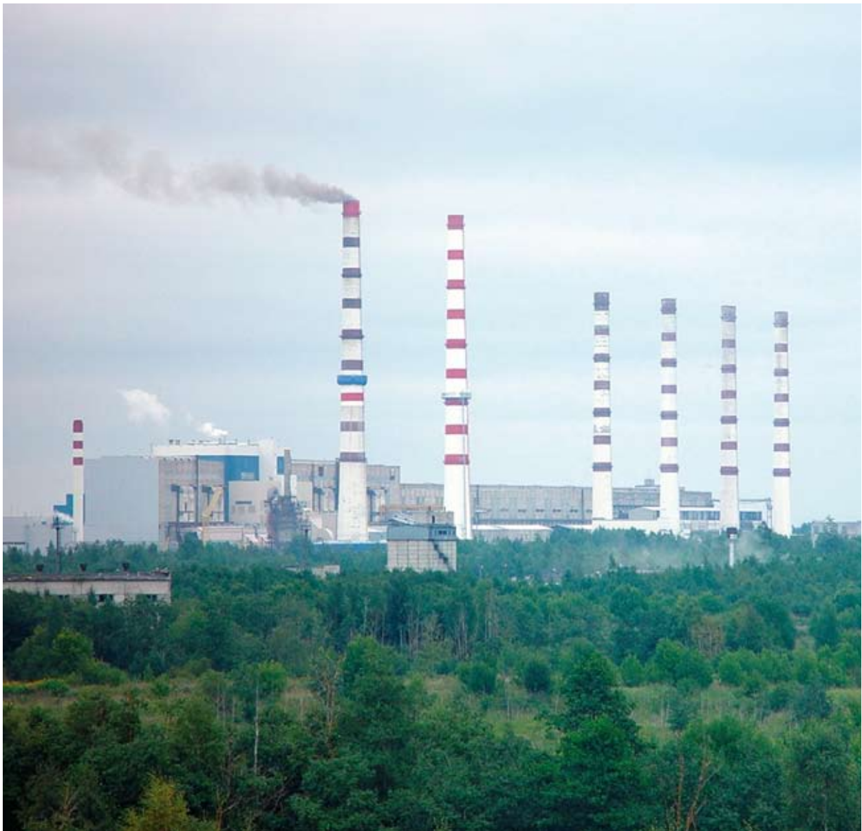
■ Σταθμός ηλεκτροπαραγωγής από πηλοσώχο σχιστόλιθο στην Εσθονία.

Η μελέτη του Κοινοβουλίου παρουσιάζει 15 παραδείγματα ορθών πρακτικών και διατυπώνει τρεις γενικές συστάσεις: καθορισμός επιτεύξιμων στόχων, στρατηγικότερη προσέγγιση στους τομείς των αισιόφων και ανανεώσιμων πηγών ενέργειας και καλύτερη διαχείριση των ενεργειακών πτυχών των παρεμβάσεων σε συγκεκριμένους κλάδους.