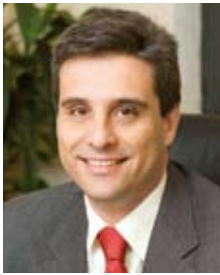
Juan Ruiz Alzola , Διευθυντής του Ινστιτούτου Τεχνολογίας Καναρίων Νήσων (ITC)

Το El Hierro, όπως και τα υπόλοιπα Κανάρια νησιά, εξαρτάται πλήρως από την εξωτερικές πηγές για την κάλυψη των ενεργειακών αναγκών του. Η ηλεκτρική ενέργεια που καταναλώνει παράγεται από