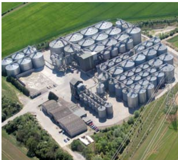
Η εταιρεία αποθήκευσης δημητριακών Camgrain, ιδιοκτήτης της οποίας είναι οι ίδιοι οι αγρότες, θα μειώσει τις εκπομπές της CO 2 κατά 1000 τόνους ετησίως.

δεδομένων των δεξιοτήτων που διαθέτει η περιφέρεια για την υποστήριξη των εξελίξεων στον τομέα αυτό, ο στόχος της εδραίωσης μιας οικονομίας χαμηλού άνθρακα στην περιφέρεια αυτή χαίρει ευρείας αποδοχής.