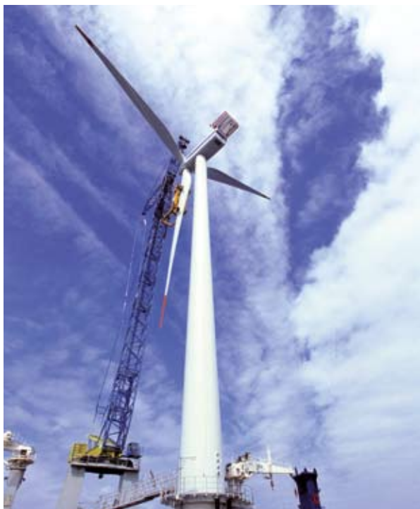
Εγκατάσταση μιας υπεράκτιας ανεμογεννήτριας.

αιολικής ενέργειας εντός της επόμενης δετίας. Τα λιμάνια του Lowestoft και του Great Yarmouth βρίσκονται στο επίκεντρο αυτών των εξελίξεων. Και τα δύο λιμάνια χρησιμοποιήθηκαν κατά την κατασκευή του αιολικού πάρκου Scroby Sands, ενός από τα πρώτα υπεράκτια αιολικά πάρκα εμπορικής εκμετάλλευσης στο Ηνωμένο Βασίλειο. Το Scroby Sands παράγει αρκετή ενέργεια για την τροφοδότηση 36 000 κατοικιών, με αποτέλεσμα τη μείωση των εκπομπών διοξειδίου του άνθρακα πέραν των 65 000 τόνων.