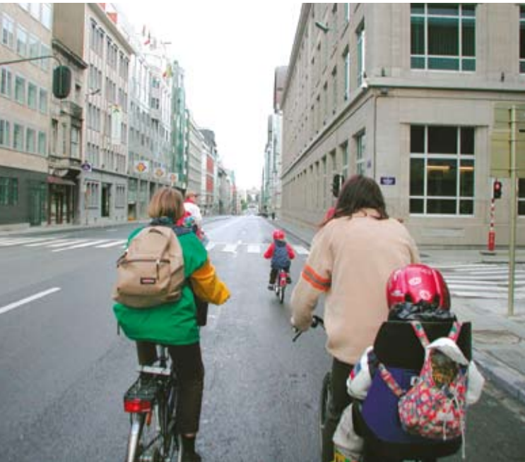
Ημέρα χωρίς αυτοκίνητα στις Βρυξέλλες (Βέλγιο).

στρατηγικές για την καταπολέμηση της κλιματικής αλλαγής. Σε αντίθεση με άλλους τομείς, και παρά τις βελτιώσεις στις επιδόσεις των οχημάτων, οι εκπομπές αερίων του θερμοκηπίου που προκαλούνται από τις μεταφορές εξακολουθούν να αυξάνονται όσο αυξάνεται το ΑΕγχΠ. Στον τομέα της αειφόρου παραγωγής, τα αποτελέσματα είναι δύσκολο να αξιολογηθούν σε ευρεία κλίμακα. Αν και όλο και περισσότερες εταιρείες παρέχουν περιβαλλοντικά βιώσιμα προϊόντα και υπηρεσίες, και παράλληλα αυξάνονται οι πρωτοβουλίες για την ενθάρρυνση των «πράσινων τεχνολογιών» και της «οικολογικής σήμανσης», υπάρχουν ακόμη πολλές ανεκμετάλλετες δυνατότητες. Όσον αφορά τους φυσικούς πόρους, η κατάσταση είναι ανομοιογενής και πολυσύνθετη. Ξεχωρίζουν ωστόσο ορισμένοι τομείς υψηλής προτεραιότητας όπως η ποιότητα του εδάφους, η βιοποικιλότητα και οι θαλάσσιοι πόροι.