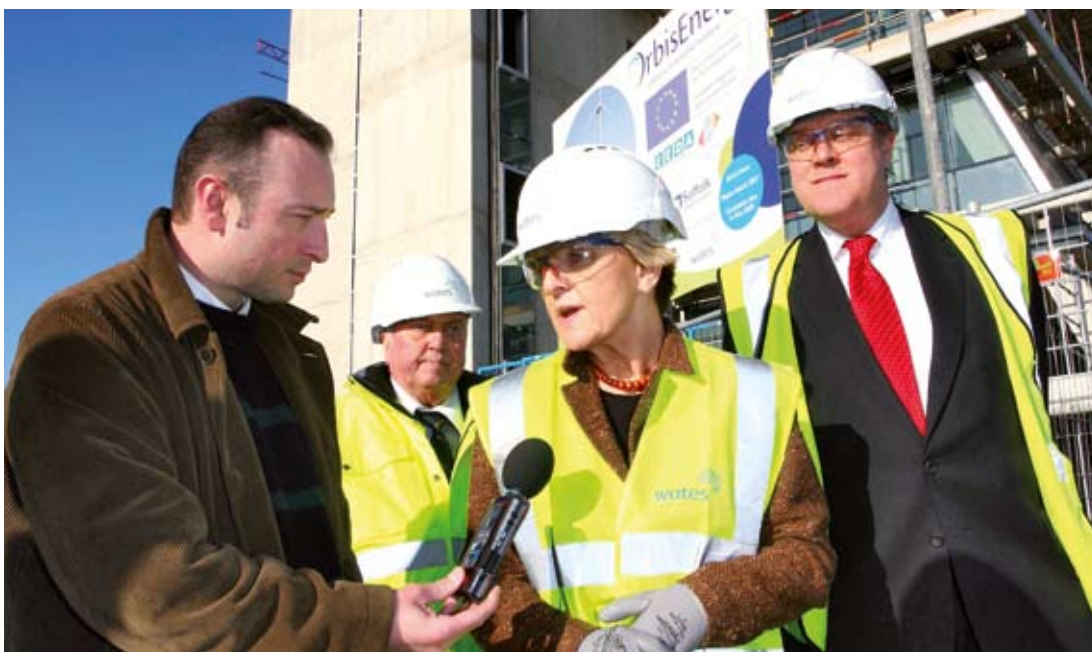
Η Επίτροπος Danuta Hübner επισκέπτεται το εργοτάξιο του OrbisEnergy τον Ιανουάριο του 2008.

Η Ανατολική Αγγλία είναι μια από τις λίγες ευρωπαϊκές περιφέρειες που ενδέχεται να πετύχει τους νέους και φιλόδοξους στόχους για τη μείωση των εκπομπών άνθρακα στην ΕΕ που έθεσε η Ευρωπαϊκή Επιτροπή στην πρόσφατη δέσμη των προτάσεων που κατέθεσε για την καταπολέμηση της κλιματικής αλλαγής και την προαγωγή της ανανεώσιμης πηγής ενέργειας. Είναι επίσης η μοναδική περιφέρεια που διαθέτει πρόγραμμα «χαμηλού άνθρακα» αξίας 110 εκατ. ευρώ του ΕΤΠΑ, ειδικά σχεδιασμένο για τη μείωση των εκπομπών CO 2 και την ενίσχυση της οικονομικής μεγέθυνσης.