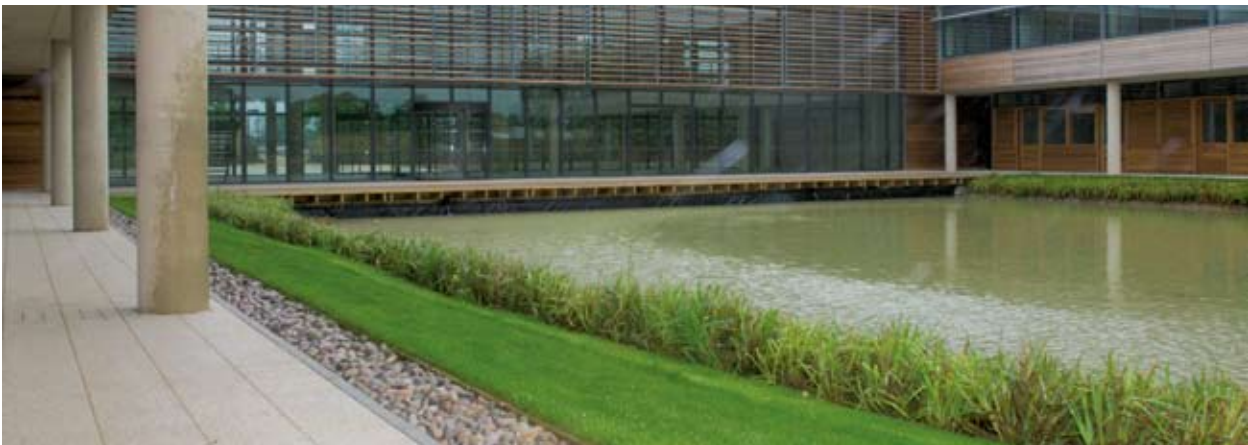
Οι εγκαταστάσεις του «Innovation and Business Base» στο Luton.

Το σχέδιο «SmartLIFE» (Smart Lifestyle Innovations for our Environment) ήταν ένα διεθνές πιλοτικό σχέδιο με επικεφαλής το συμβούλιο της Κομητείας του Cambridgeshire, σε εταιρική σχέση με την Υπηρεσία Περιβάλλοντος του δήμου του Malmö στη Σουηδία και την εταιρεία TuTech Innovation GmbH από το Αμβούργο (Γερμανία). Το σχέδιο SmartLIFE επικεντρώθηκε στο πρόβλημα της ανεπάρκειας των δεξιοτήτων και των ικανοτήτων που θα επέτρεπαν στην κατασκευαστική βιομηχανία να οικοδομήσει περιβαλλοντικά βιώσιμες κατοικίες σε προσιτές τιμές. Στο πλαίσιο του σχεδίου θεσμοθετήθηκαν πολλά εκπαιδευτικά προγράμματα και επαγγελματικά προσόντα. Από τα κέντρα κατάρτισης που δημιούργησε το SmartLIFE πέρασαν περίπου 2 500 εκπαιδευόμενοι. Στο σχέδιο απονεμήθηκαν πολλά περιβαλλοντικά βραβεία και επιπλέον συμπεριλήφθηκε στον κατάλογο των επίλεκτων υποψηφίων σχεδίων για το βραβείο RegioStars 2008 της ΓΔ.