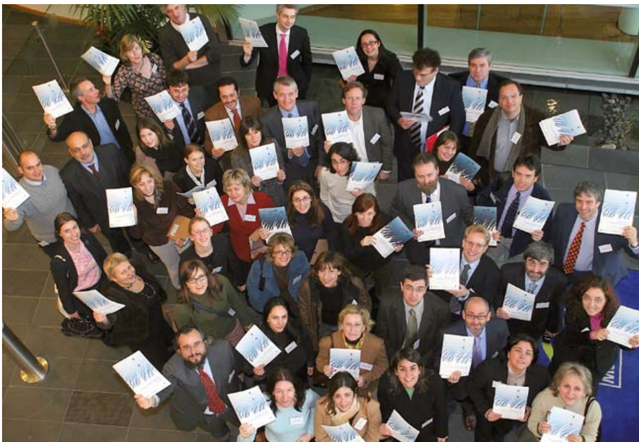
Συμμετέχοντες σε σεμινάριο στο Exeter της Αγγλίας το 2006.

Το δίκτυο Greening Regional Development Programmes (πρασινίζοντας περιφερειακά αναπτυξιακά προγράμματα) (GRDP) ανέπτυξε διάφορα προϊόντα που επιτρέπουν στους δημόσιους φορείς να αποδώσουν τη δέουσα σπουδαιότητα στις περιβαλλοντικές πτυχές της τοπικής και περιφερειακής ανάπτυξης.