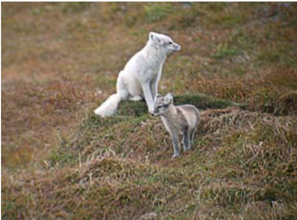
Το τρίχωμα της αρκτικής αλεπούς έχει ήδη επηρεαστεί από την κλιματική αλλαγή.

και την ηπειρωτική Ευρώπη λόγω των συχνότερων ξηρασιών. Επιπλέον, ο κίνδυνος πυρκαγιών στη Νότια Ευρώπη θα αυξηθεί. Οι ορεινές περιοχές, όπως οι Άλπεις, είναι ιδιαίτερες ευάλωτες στην κλιματική αλλαγή και ήδη υφίστανται τις επιπτώσεις θερμοκρασιακών αυξήσεων υψηλότερων του μέσου όρου· στις περιοχές αυτές, το λιώσιμο των παγετώνων και των μονίμων παγωμένων εδαφών ή πετρωμάτων (γνωστά ως περμαφρόστ) είναι πιθανό να οδηγήσουν σε μαζικές φυσικές καταστροφές, διάβρωση του εδάφους και πλημμύρες. Η Αυστρία έχει ήδη αρχίσει την αξιολόγηση αυτών των κινδύνων και των συναφών επιπτώσεων στο χειμερινό τουρισμό της, εκτιμώντας την τρωτότητά της στις επιπτώσεις της κλιματικής αλλαγής και εκπονεί δυνητικά σχέδια δράσης ώστε να προσαρμοστεί εγκαίρως ελαχιστοποιώντας το κόστος για την κοινωνία. Η κλιματική αλλαγή μπορεί να έχει σοβαρότατες συνέπειες για τις παράκτιες ζώνες λόγω της ανόδου της στάθμης των υδάτων και των αλλαγών στη συχνότητα ή/και στην ένταση των καταγίδων. Οι Κάτω Χώρες, σε συνεργασία με ενδιαφερόμενα μέρη από όλους τους οικονομικούς κλάδους, αναπτύσσουν σχέδια για το μετριασμό των κινδύνων λόγω παράκτιων πλημμυρών και υπερχειλίσης των ποταμών. Τα παράκτια ενδιαιτήματα και οικοσυστήματα στη Βαλτική, τη Μεσόγειο και τη Μαύρη