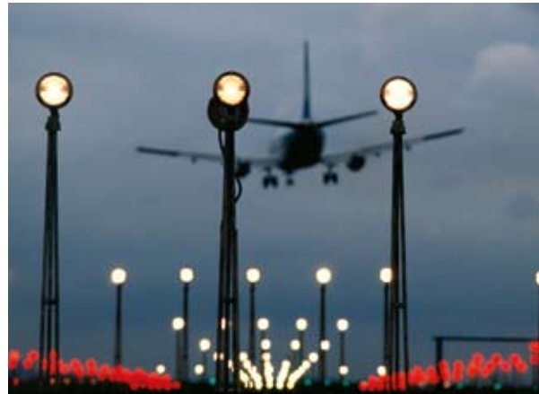
Τα αεροπορικά ταξίδια είναι μια από τις ταχύτερα αυξανόμενες πηγές ρύπανσης και εκπομπών διοξειδίου του άνθρακα.

Το οικονομικό κόστος των επιπτώσεων της κλιματικής αλλαγής (δηλαδή το κόστος της μη ανάληψης δράσης) επικαθορίζει ολοένα και περισσότερο το διάλογο για τη χάραξη πολιτικών. Αυτό είναι αναγκαίο αν θέλουμε να αναπτύξουμε επαρκείς προσαρμοστικές αντιδράσεις προκειμένου να μετριασθούν οι ζημιές ή να