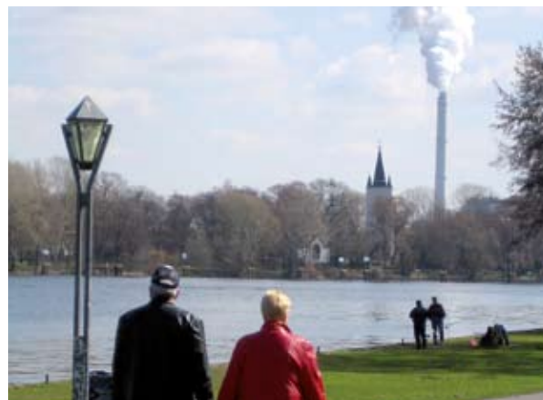
Η ανάπτυξη και εφαρμογή μέτρων προσαρμογής είναι ένα σχετικά νέο ζήτημα.

και η λειψυδρία στις περιφέρειες της Νότιας Ευρώπης και της Μεσογείου. Ένα πρώτο βήμα προς αυτή την κατεύθυνση είναι η υλοποίηση δράσεων μέσω των υπαρχουσών στρατηγικών και πολιτικών. Για παράδειγμα, προκειμένου να αυξηθεί η διαθεσιμότητα και η ποιότητα του νερού και να μετριαστούν οι συνέπειες των πλημμυρών, πρέπει να αξιοποιηθεί η οδηγία-πλαίσιο για τα ύδατα και η σταδιακή/κυκλική προσέγγιση που προκρίνει. Είναι σημαντικό τα κράτη μέλη της ΕΕ να λαμβάνουν τώρα μέτρα ώστε να συζητηθεί πώς μπορεί να διασφαλιστεί η ενσωμάτωση της κλιματικής αλλαγής στα σχέδια διαχείρισης των λεκανών απορροής ήδη από τον πρώτο κύκλο που θα ξεκινήσει το 2009. Μπορούν να γίνουν ουσιαστικές διασυνδέσεις με τη χωροταξία δεδομένου ότι απαιτείται η ενεργός συμμετοχή των ενδιαφερόμενων φορέων προκειμένου η προσαρμογή να γίνει αποδεκτή και να επιτύχει. Μεταξύ των σημαντικών ενδιαφερόμενων μερών συγκαταλέγονται οι υποεθνικές και τοπικές αρχές, οι επιχειρήσεις και οι πολίτες. Ειδικότερα οι χωροτάκτες θα κληθούν να εργαστούν εντός των αντίστοιχων πλαισίων ώστε να διασφαλιστεί ότι θα λαμβάνουν υπόψη την κλιματική αλλαγή· καθώς πρόκειται για άτομα που ασχολούνται με σχεδιασμό σε διαφορετικές κλίμακες, θα μπορέσουν να προάγουν την αξιολόγηση της προσαρμοστικότητας ενοποιώντας τις επιμέρους προσεγγίσεις.