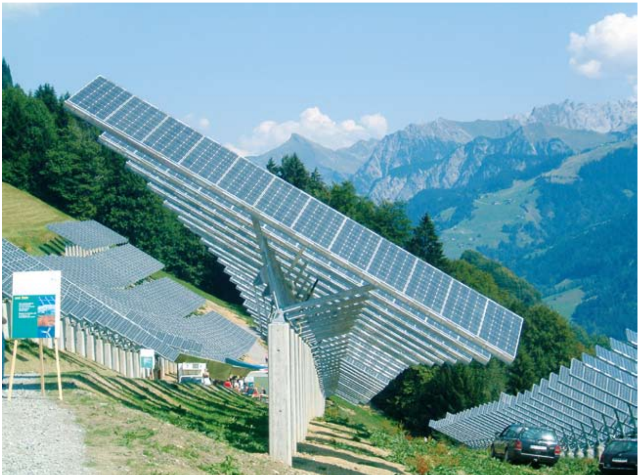
Μεγάλο φωτοβολταϊκό σύστημα που παράγει 530 MWh από ηλιακή ενέργεια στο Blons της Αυστρίας.

Η κλιματική αλλαγή – και ο αντίκτυπός της στην παραγωγή και τις καταναλωτικές μας συνήθειες – αποκτά ολοένα σημαντικότερη θέση στην πολιτική για την αειφόρο ανάπτυξη. Βρίσκεται συνεπώς στον πυρήνα της περιφερειακής ανάπτυξης, ως μια άνευ προηγουμένου πρόκληση, αλλά και ευκαιρία για τις περιφέρειες της Ευρώπης, που καλούνται να δραστηριοποιηθούν στους τομείς της καινοτομίας και της δημιουργίας θέσεων εργασίας.