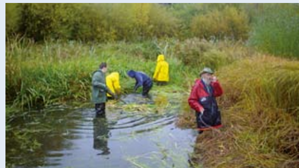
Η φροντίδα των οικοσυστημάτων μάς αφορά όλους.

Το άρθρο 1 του Κανονισμού για το Ταμείο Συνοχής επαναλαμβάνει ότι το Ταμείο δημιουργείται με σκοπό να ενισχυθεί η οικονομική και κοινωνική συνοχή της Κοινότητας με προοπτική την προώθηση της βιώσιμης ανάπτυξης ενώ το άρθρο 2 τονίζει τη νέα εστίαση του Ταμείου στη βιώσιμη ανάπτυξη κηρύσσοντας επιλέξιμους τους τομείς της «ενεργειακής απόδοσης» και των «ανανεώσιμων πηγών ενέργειας».